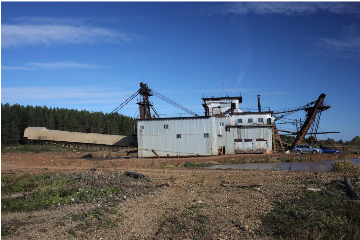
Драга в работе (Au, Pt, Ir, Os и т.д.) на Исе.