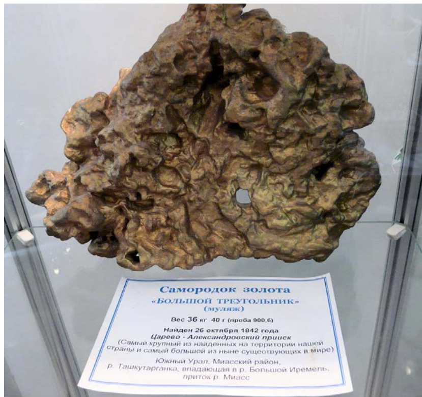
Екатеринбург. Золотой самородок весом 36 кг с Ташкутарганки (Миасс). Сокровищница музея ИГГУ.