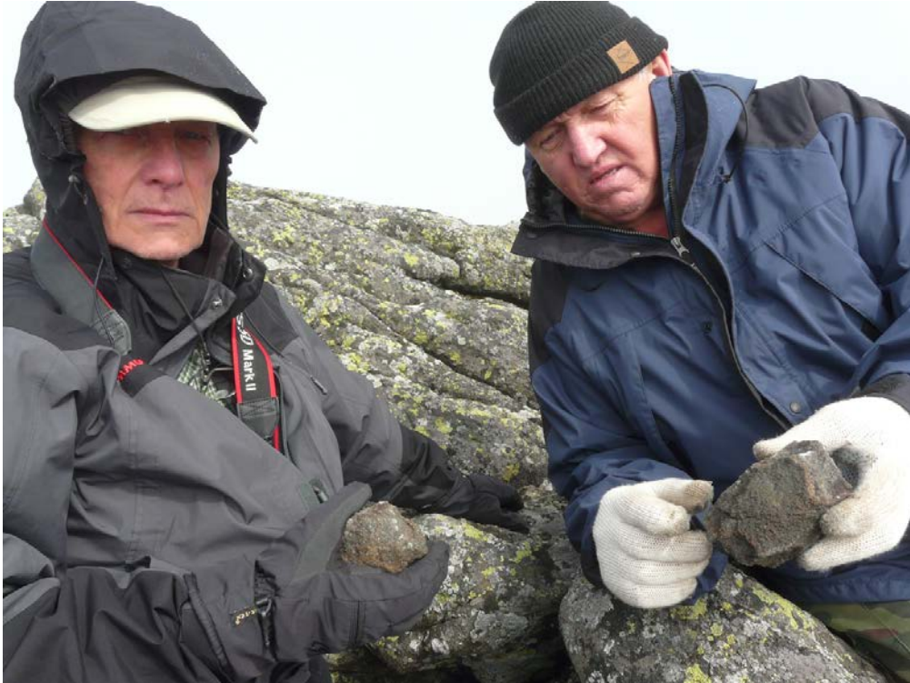
Дюпарков Камень. Пироксенит и титаномагнетит с вершины, поделённые между Исовским геологоразведочным техникумом (ИГРТ) и Женевским музеем естественной истории (MHNG).