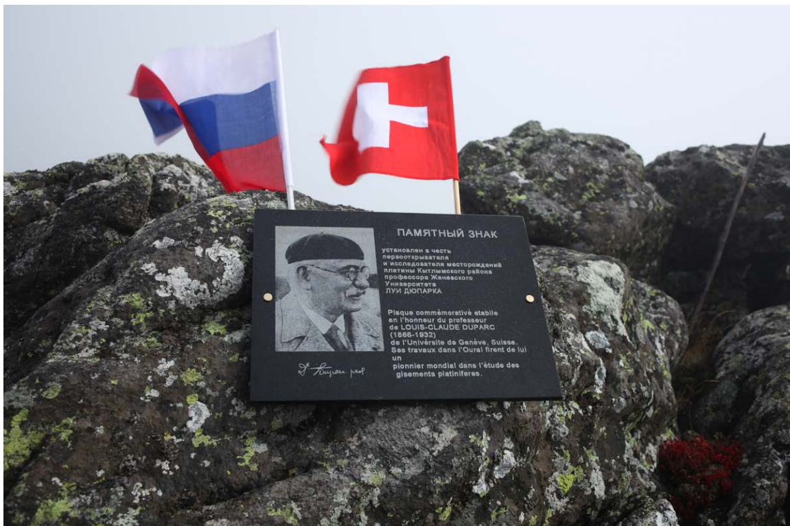
Дюпарков Камень, 5 сентября 2014. Мемориальная доска из диорита в честь Луи Дюпарка. [на ту же тему (2015) ->]