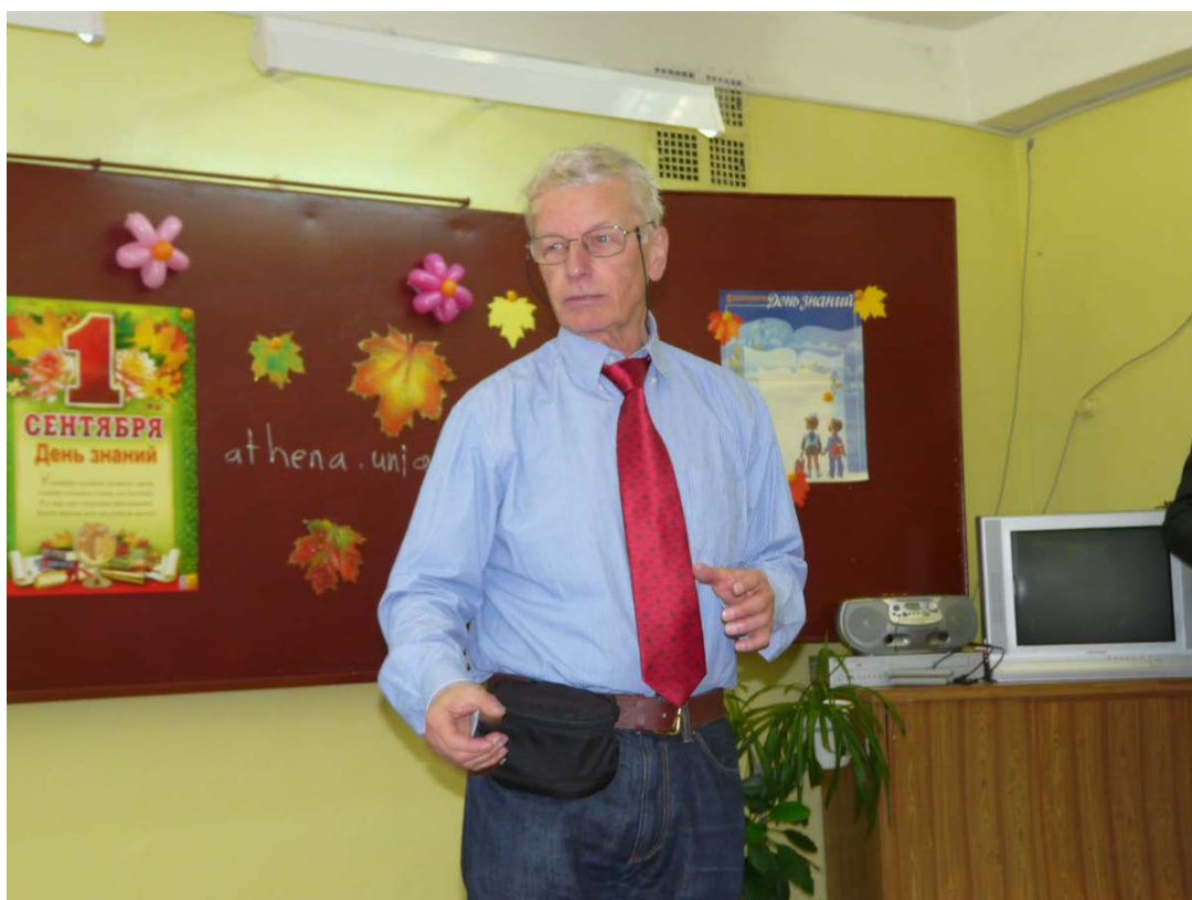
Визит в одну из школ Нижней Туры, чтобы рассказать учащимся о Женевском университете, ресурсах сайта athena.unige.ch , письме посла Швейцарии о совершенстве исследований в России и Швейцарии, о фрибургских сырах и пр..