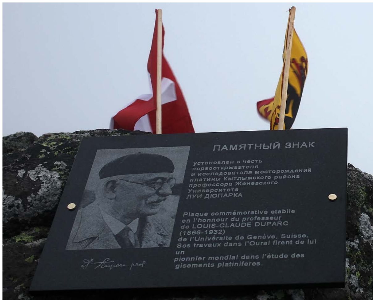
Памятник открыт 5 сентября 2014 г. на вершине 1311 Конжаковского массива.

сентябрь 2014 г. Перевод: Karine Perroud