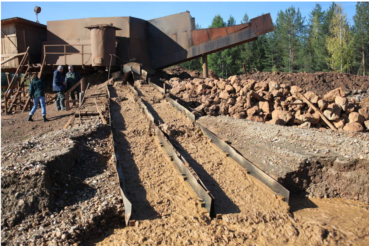
Работа старателей (Au, Pt, Ir, Os и т.д.) на Исе. Землю привозят грузовиками из карстовых участков, где была обнаружена Pt.