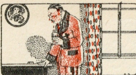
Recueillir et détruire ses crachats.