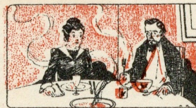
Couverts et ustensiles à soi.