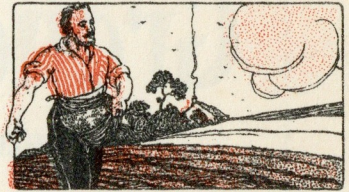
Soleil et Grand air.