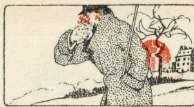
Protéger sa bouche en toussant ou éternuant.