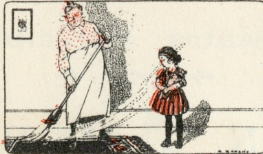
Poussières respirées ou avalées