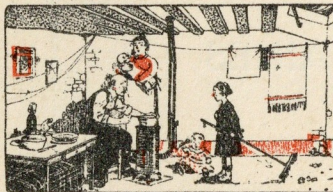
Locaux sales et poussiéreux

LES RAVAGES DE LA TUBERCULOSE COMPARÉS A CEUX DES AUTRES MALADIES