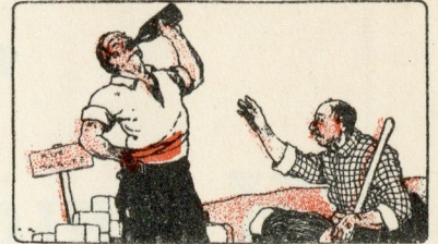
Objets portés à la bouche