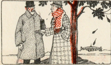
Crachats et postillons